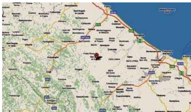
San Lorenzo in Campo (PU)

Biblioteca Pedagogica “Lorenzo Bettini” tel. 041 5220557 fax 041 717361 mail biblioteca.bettini@comune.venezia.it