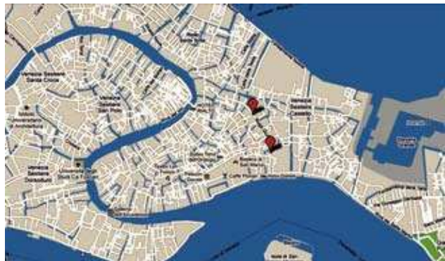
1 – Fondazione Scientifica Querini Stampalia 2 – Biblioteca Pedagogica “Lorenzo Bettini”